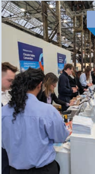
Karrieremesse in Aktion: Was früher 120 Arbeitsstunden kostete, erledigt FairUp dank KI-Unterstützung in nur 30 Stunden.