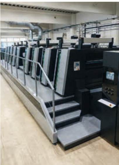
In Betriebnahme im Mai 2026

Beratung Kreation Produktion Lettershop Logistik & Warehouse